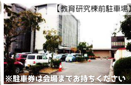
※駐車券は会場までお持ちください

当日のプログラム（予定） *香川大学佐々木教授による新しい試みの発表 *親子で思い出作り