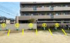
緑色のコーンが目印です。